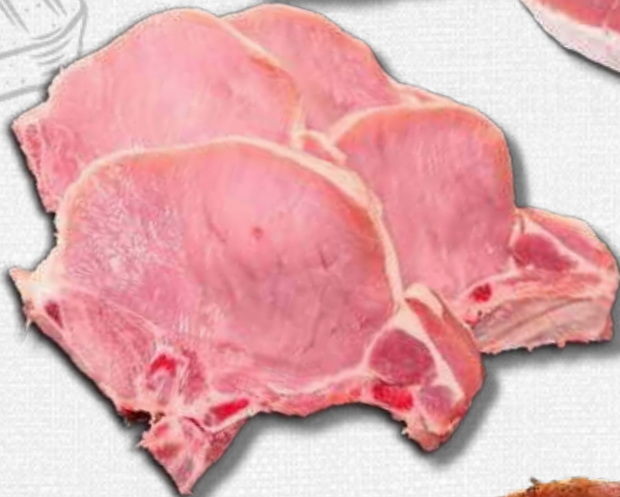
FRISCHE STIELKOTELETTS das schnelle Pfannengericht 100 g